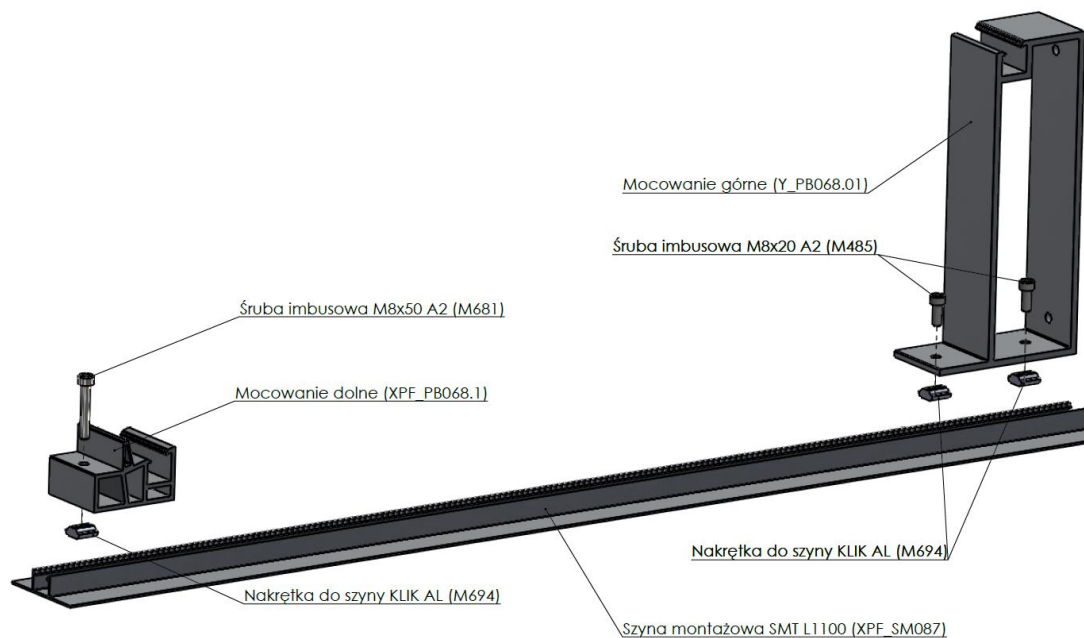
Rys. 1 Montaż mocowania dolnego (XPF_PB068.1) i górnego (Y_PB068.1) na szynie SMT L1100 ( XPF_SM087)

[1] W przypadku opcjonalnego montażu mocowań górnych i dolnych na szynie (XPF_SM087) L=1100 wykorzystywane są elementy złączne: śruby M8x20 (mocowanie górne), M8x50 (mocowanie dolne) oraz nakrętki do szyny typu klik (M694).